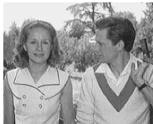
Sanda e Capolicchio nel Giardino dei Finzi Contini

città sarebbero in tanti. Naturalmente la Fondazione Bassani e la Fondazione Cassa di Risparmio di Ferrara che già stanno lavorando alla mostra. Ma anche le istituzioni, il Comune, l'Università, il Liceo Classico Ariosto (uno dei "baluardi" bassaniani), la Comunità Ebraica, varie associazioni culturali (da quelle di scrittori ai circoli fotografici); da sottolineare persino la grande valenza turistica (i luoghi e i percorsi bassaniani stanno sempre più crescendo). L'elenco rischia d'essere interminabile. (f.z.)